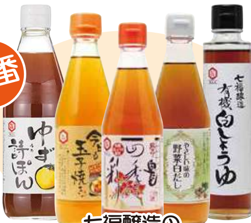
七福醸造の 白しょうゆ&白だしシリーズ