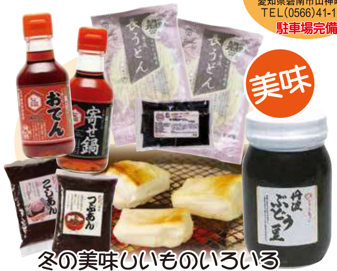
冬の美味しいものいろいろ