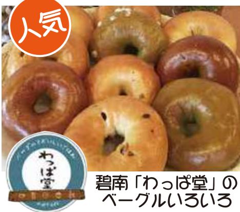
碧南「わっぱ堂」の ベーグルいろいろ