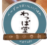
碧南「わっぱ堂」の ベーグルいろいろ