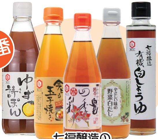
七福醸造の 白しょうゆ&白だしシリーズ