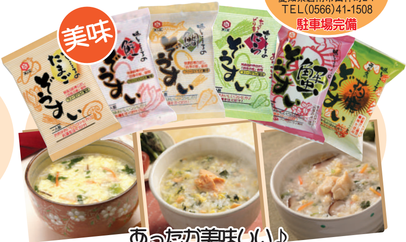
あつたが美味しい♪ フリーズドライの雑炊いろいろ