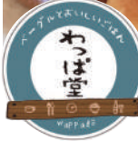
碧南「わっぱ堂」の ベーグルいろいろ